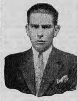
Lic DON TEODORO PICADO

Tuvimos el gusto de acompañar al señor Subsecretario de Educación en su reciente gira por los cantones de Alfaro Ruiz y San Carlos, de la provincia de Alajuela, y Puriscal y Mora, de la de San José. A continuación damos una reseña de los principales puntos de esta gira.